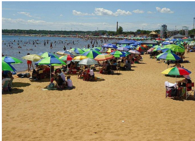
Figura 3: Playa San José.