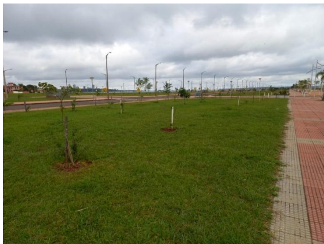
Figura 2: Paseo Villa Baja.

La figura 2 muestra el espacio público con infraestructura verde en el llamado paseo Villa Baja que conecta con la avenida costanera República del Paraguay en el área recuperada.