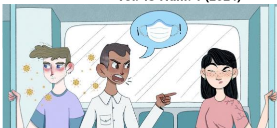
Figura 3. Representación de Estigma social en COVID