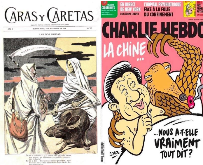
Figura 2. A. “Las dos parcas”, Caras y Caretas , nº 57, 4/11/1899. Biblioteca Nacional de España, España. Figura 2. B. La portada del 24 de abril 2020 de Charlie Hebdo, revista Francesa, Francia.