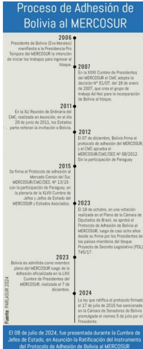
Figura 1: Proceso de adhesión de Bolivia al Mercosur.